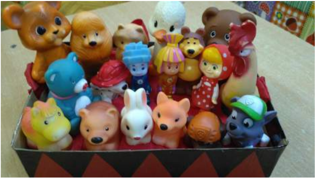
Театр известных мультяшных героев.